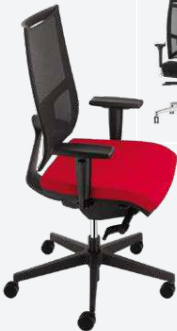
Bürodrehstuhl Team Strike