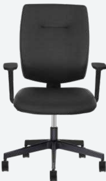
Bürodrehstuhl Team Strike Evo