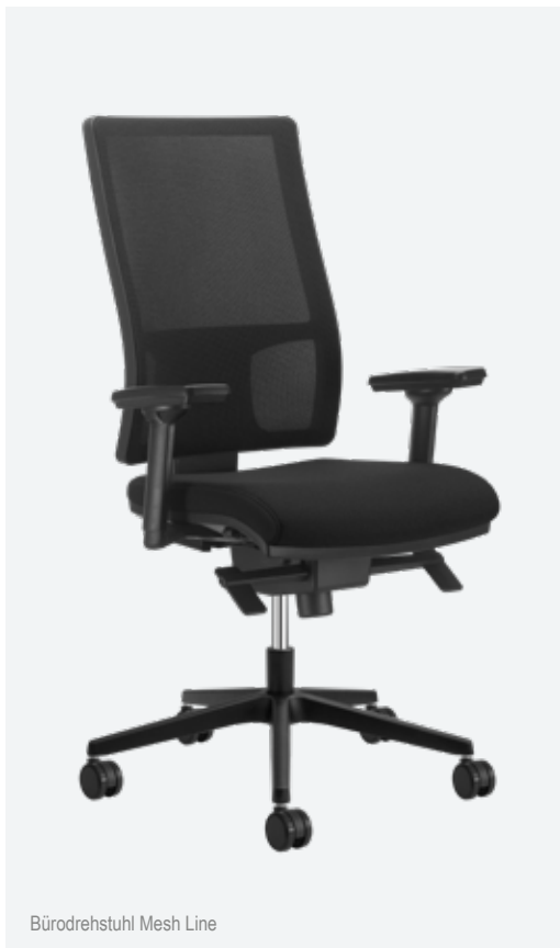
Bürodrehstuhl Mesh Line