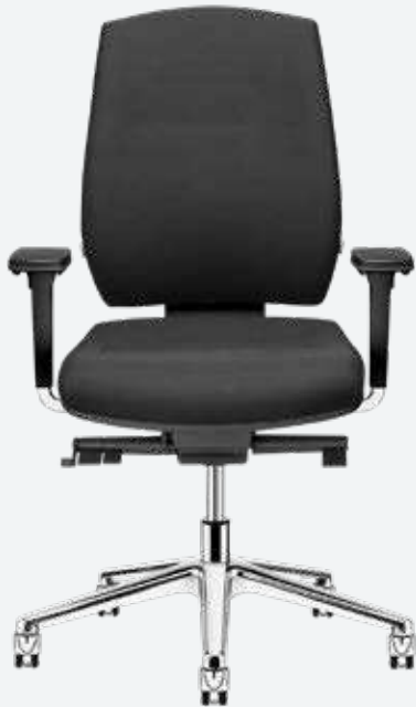
Bürodrehstuhl Team W