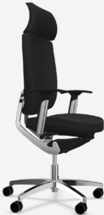
Bürodrehstuhl Spirit mit Sitzneigung bis 4°