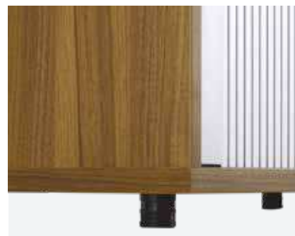
Stellfüsse Kunststoff 3,5 cm hoch, Niveaueingleich 15 mm, Farbe: Schwarz