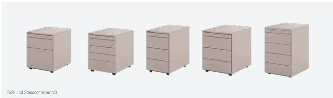
Roll- und Standcontainer ND