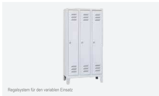
Regalsystem für den variablen Einsatz