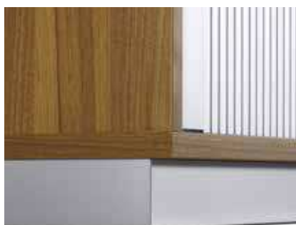
Stahlsockel 7,0 cm hoch, Niveaueingleich bis 20 mm, Pulverbeschichtung, Farbe wählbar, gemäss Kollektion Hersteller