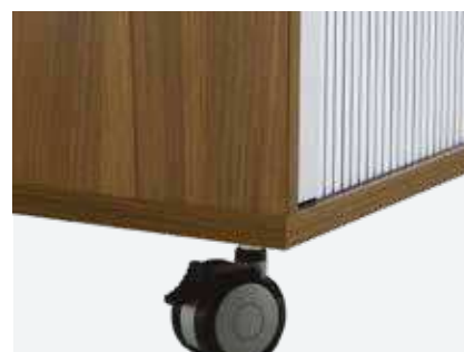
Kunststoffrollen 9,8 cm hoch, feststellbar, Farbe Schwarz/Silber (für max. 75 cm Schrankhöhe)