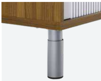
Rundfüsse, höhenstellbar von 13–21 cm, Pulverbeschichtung, Farbe wählbar, gemäss Kollektion Hersteller