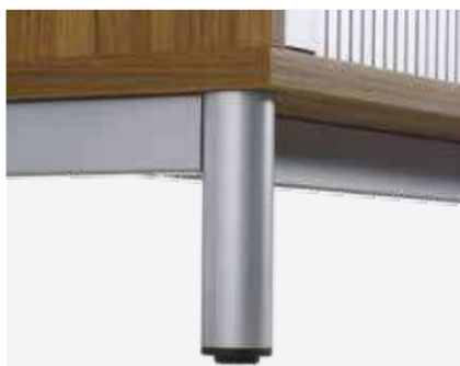
Rundrohrgestell 17 cm hoch, Niveaueingleich bis 20 mm, Pulverbeschichtung, Farbe wählbar, gemäss Kollektion Hersteller