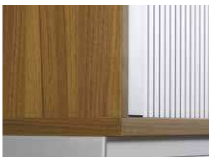
Stahlsockel 3,5 cm hoch, Niveaueingleich bis 20 mm, Pulverbeschichtung, Farbe wählbar, gemäss Kollektion Hersteller