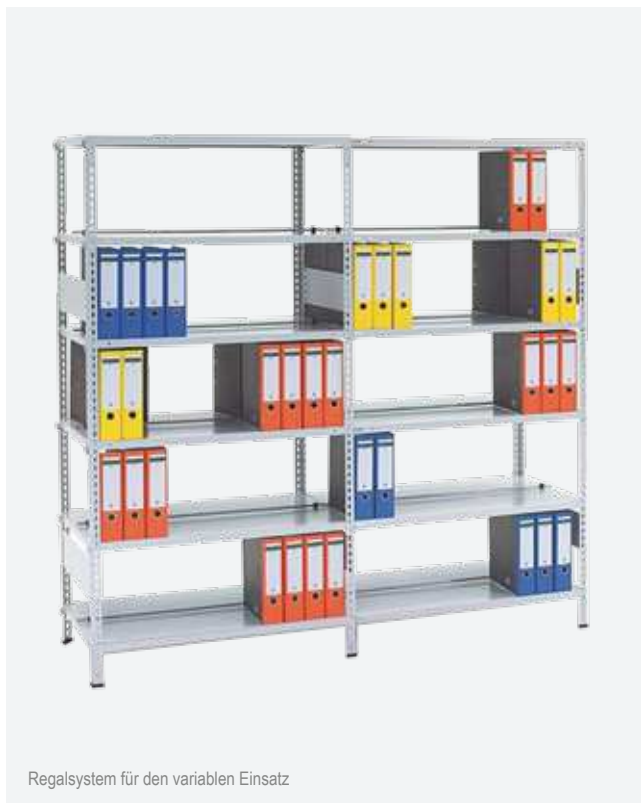
Regalsystem für den variablen Einsatz