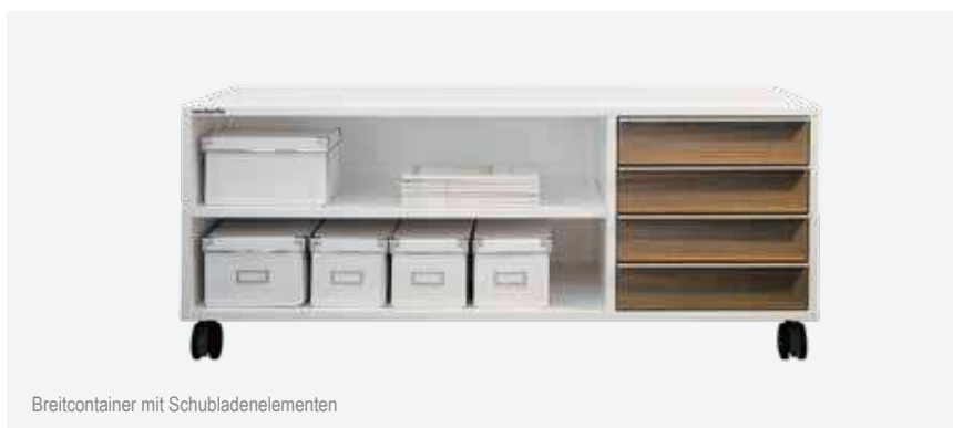
Breitcontainer mit Schubladenelementen