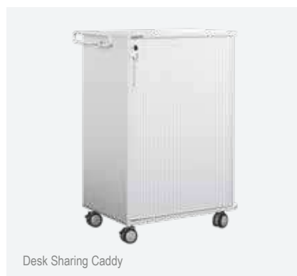
Desk Sharing Caddy