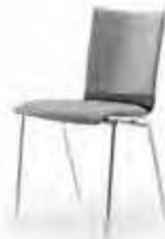
Sitz- und Rückenpolster