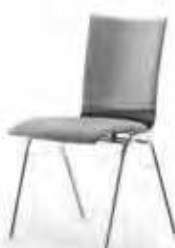
Sitz- und Rückenpolster