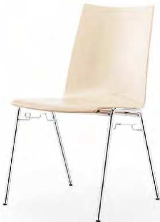
Stapelstuhl Atlanta 450 R

Der Vierfussstuhl Atlanta 450 ist ein echter Klassiker, ob als Vierfussstuhl oder als Freischwinger. Grosse Variationsvielfalt und ein hervorragendes Preis-Leistungs-Verhältnis. Die Formholzschale kann (deck-)lackiert, gebeizt oder mit Schichtstoff belegt werden und eröffnet damit ein breites Gestaltungsspektrum. Die Stapelbarkeit sowie die optionale Reihenverbindung machen Atlanta zum idealen Stuhl für Mehrzweckhallen, Veranstaltungsräume, Schulen und Cafeterien.