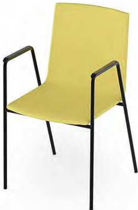
Stapelstuhl Atlanta 452

Der Vierfüsstuhl Atlanta 452 ist ein schlichter und zeitloser Stahlrohrstuhl mit geschlossener Armlehne und ist optimal für den Care-Bereich geeignet. Neben sehr hohem Sitzkomfort, sorgt die auf 0° angepasste Sitzneigung für einfacheres Aufstehen. Die Formholzschale kann (deck-)lackiert, gebeizt oder mit HPL belegt werden und eröffnet damit ein breites Gestaltungsspektrum.