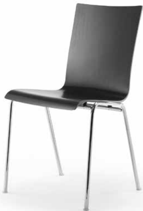
Stapelstuhl Atlanta 50

Der Stapelstuhlklassiker Atlanta 50 schafft durch seine drei verschiedenen Schalenformen Individualität und Vielfalt und überzeugt gleich vierfach in Qualität, Preis, Sitzkomfort und Funktionalität. Zahlreiche Farb- und Polstervarianten sorgen für hohen Individualisierungsgrad. Die Atlanta Gestellverbindung erfolgt durch induktives Schmelzschweisverfahren, somit gibt es weder Schweissnähte noch unschönen sichtbaren Materialauftrag.