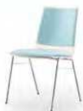
Sitz- und Rückenpolster