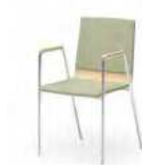
Sitz- und Rückenpolster