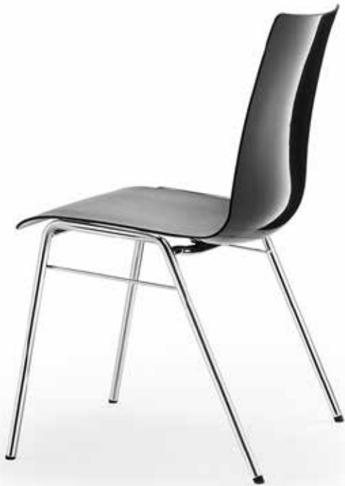
Stapelstuhl Atlanta 456

Atlanta 456 ist die junge Version des Stapelstuhl Klassikers – frech, trendig, eben einfach anders. Blickfang ist die pflegeleichte, stossfeste Polypropylen-Schale, die mit ihrer elegant geschwungenen Form, ihrer aussergewöhnlichen Oberflächenkombination mit matter Vorderseite und hochglänzender Rückseite und nicht zuletzt mit einer grossen Farbauswahl gleich mehrfach punktet.