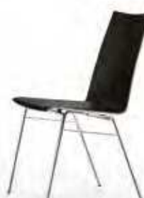
Stapelsteg mit Reihenverbindung 'Elegance'