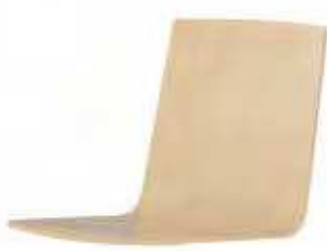
466 | H 860 mm