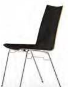
Stapelsteg mit intuitiver Krallen-Reihenverbindung