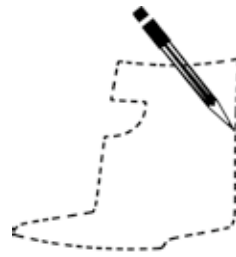
Schalenkonturen frei wählbar