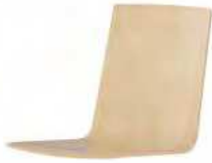
467 | H 890 mm