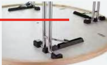
Klappbeschlag mit automatisch hochfahendem Stapelklotz

HINWEIS: Genialer Mechanismus macht es möglich, dass der Tisch sich selber ausnivelliert auch ohne Verstellgleiter! Testen Sie es mit einem CHF 5.- Stück!