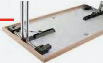
Klappbeschlag mit automatisch hochfahrendem Stapelklotz

HINWEIS: Genialer Mechanismus macht es möglich, dass der Tisch sich selber ausnivelliert auch ohne Verstellgleiter! Testen Sie es mit einem CHF 5.- Stück!