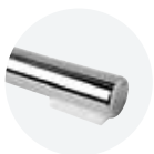
Polyamidgleiter | Filzgleiter