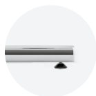
höhenverstell- barer Gleiter