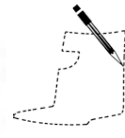
Schalenkonturen frei wählbar