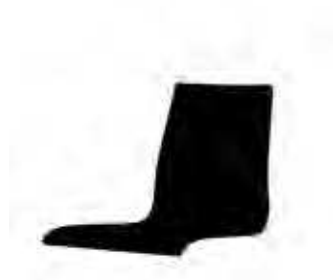
202 | H 1180 mm