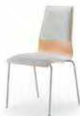
Sitz- und Rückenpolster