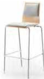
Sitz- und Rückenpolster