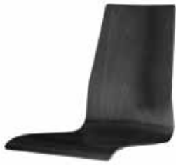
200 | H 900 mm