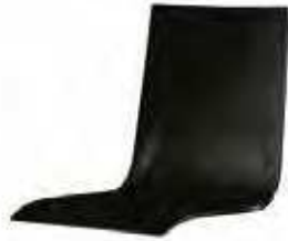
201 | H 900 mm nur bei Schwerlast Variante erhältlich