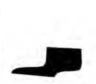
203 | H 910 mm