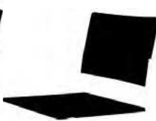
211 | H 800 mm