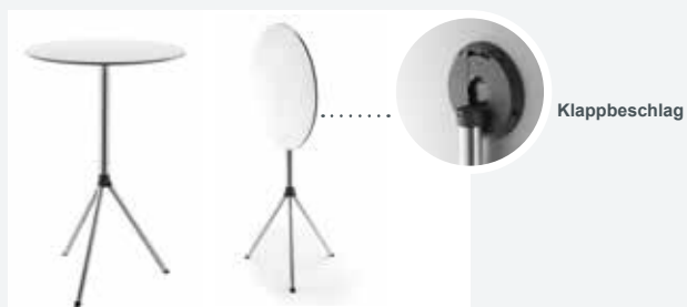
Mollinaro STT | Klapp-Stehtisch Tischplatte weiss | auf- und zugeklappter Zustand mit Tischhaken

Die Tische sind in vielen verschiedenen Farben, Dekoren, Materialien und Veredelungen erhältlich.