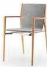
Vorpolster mit Armlehnen