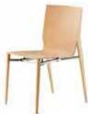
Ungepolstert ohne Armlehnen