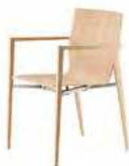
Ungepolstert mit Armlehnen