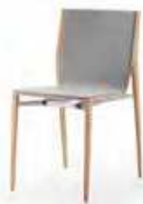
Vorpolster ohne Armlehnen